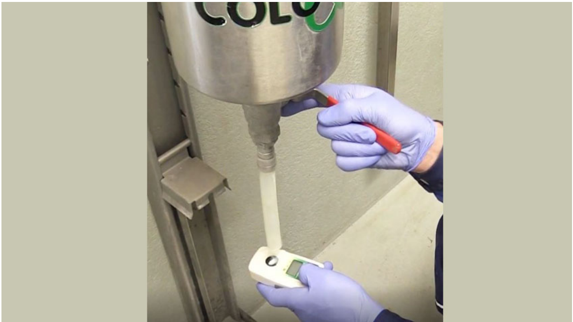
Undersøg råmælken for tilstrækkeligt indhold af antistoffer med Brixmåler. Kalvens første råmælk skal have en værdi på mindst 22.